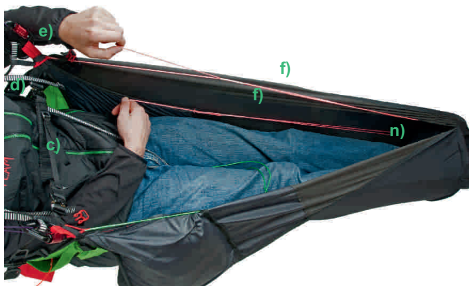
inside life leg cover