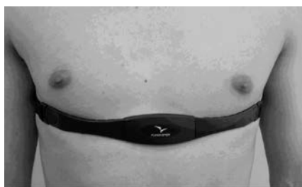
Положение Heart-G на теле

Включение и выключение HEART-G осуществляется автоматически. Если батарея HEART-G исправна и заряжена, HEART-G включается если прибор одет как показано на рисунке и электроды имеют контакт с кожей. Для достижения наилучшего результата мы рекомендуем: