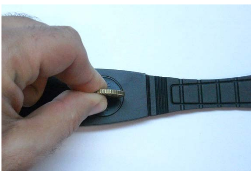
Открытие батарейного отсека